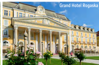
Grand Hotel Rogaska